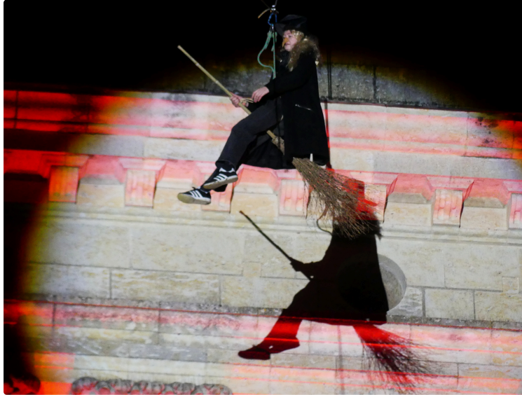
La BEFANA,, si con molti successi

Les années se suivent et le succès est toujours plus présent. Samedi 4 en fin d'après-midi plus de 2000 spectateurs sont venus voir la BEFANA ( voir notre article de présentation ). Les enfants sont repartis émerveillés comme chaque année, après le conte de la BEFANA au théâtre municipal, la déambulation des rois mages sur la place de la cathédrale accompagnés par le groupe de musique occitane (ACPPG), le mini concert du violoncelliste (la nouveauté du jour) au premier étage de la cathédrale, la descente très attendue de la BEFANA et bien sûr la distribution des friandises et au final le fameux Pignarûl toujours aussi difficile à démarrer le capricieux.