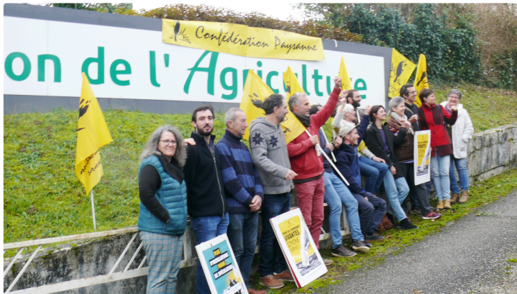
Eléctions de la Chambre d'agriculture : la Confédération paysanne lance sa campagne

Trois priorités sont mises en évidence : des prix rémunérateurs, la transition écologique, la défense de l'élevage paysan