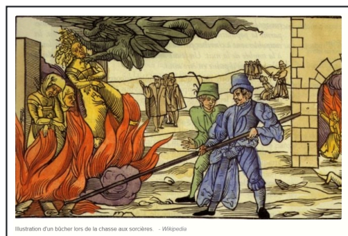
Illustration d'un bûcher lors de la chasse aux sorcières

Les accusations de sorcellerie étaient parfois basées sur des ragots, des jalousies locales ou des querelles familiales. Les femmes accusées de sorcellerie étaient parfois les victimes d'une société patriarcale où la peur de l'inconnu et la superstition alimentaient des chasses aux sorcières cruelles. On les accusait de se rendre à des sabbats où elles invoquaient des forces obscures et participaient à des cérémonies sataniques. En réalité, nombre d'entre elles étaient simplement des guérisseuses ou des sages-femmes, souvent mal comprises ou maltraitées par une société en quête de boucs émissaires.