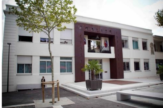
Ordre du jour du prochain conseil municipal