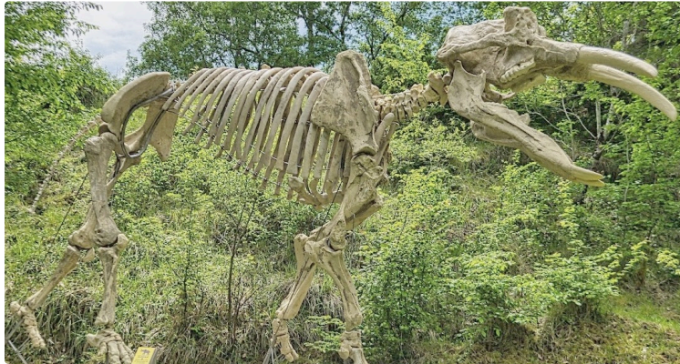
Création d'un centre d'interprétation pour le site paléontologique.

Un enjeu majeur pour la mise en valeur de l'un des sites paléontologiques les plus importants de France.