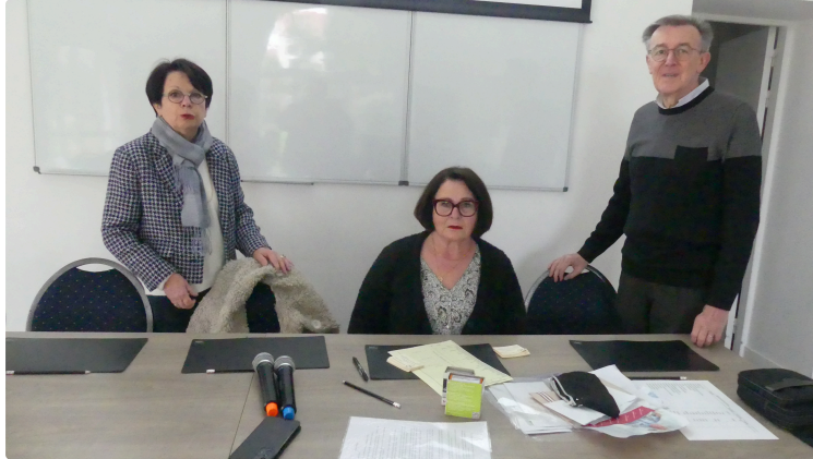
Comme un parfum d'Algérie à Condom