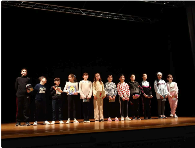
Petits Champions de la Lecture à l'école Louis Monge : deux élèves sélectionnés pour la finale départementale

Les CM1 et les CM2 de l'école Louis Monge participent à un concours national dont la première étape se situe au niveau de l'école: "Les Petits Champions de la lecture" : la finale de l'école a eu lieu ce jeudi 23 janvier matin au théâtre « Le Méridional » de Fleurance.