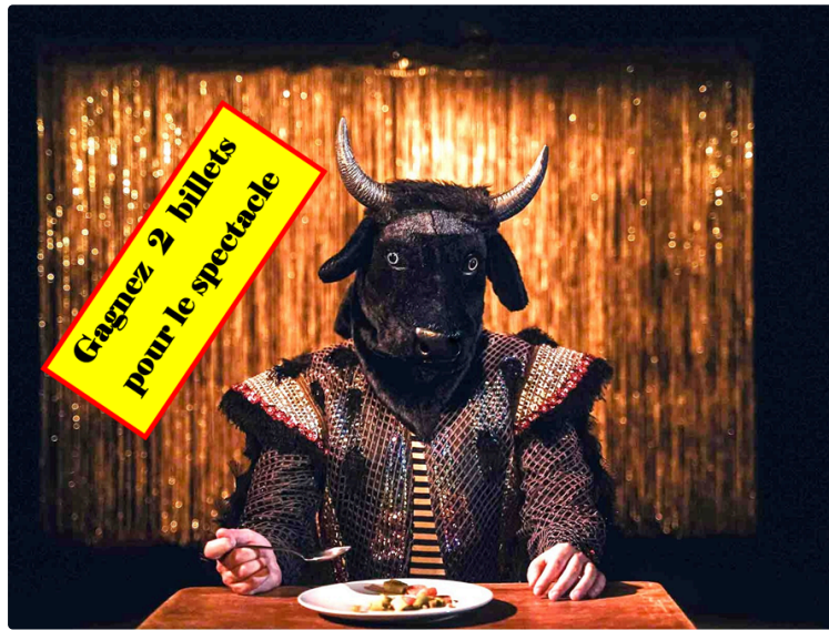
Parler pointu mercredi au dôme de Gascogne