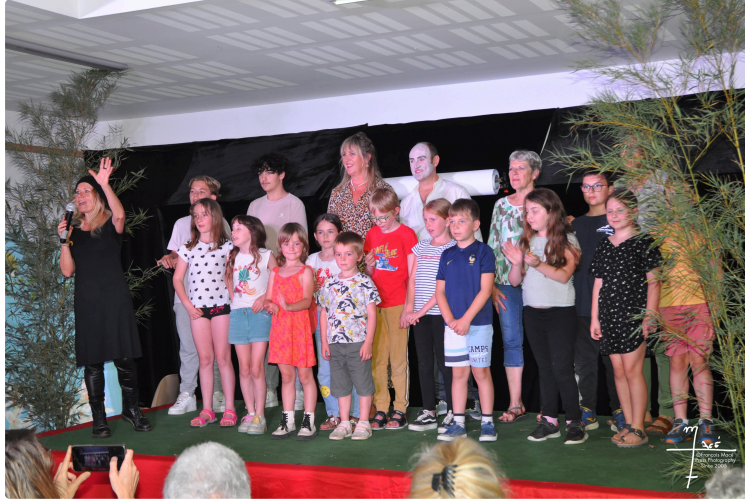
Venez vous initier à la comédie musicale avec les Tréteaux Vicois !

Les Tréteaux Vicois proposent leur 2e stage de vacances sur le thème de la comédie musicale !