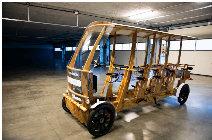
Le woodybus de profil

N.B. - Sur la photo du haut de page, le woodybus dans un stand du circuit de >Nogaro.