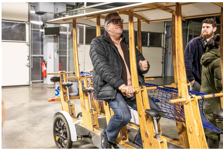
Impossible pour des adultes d'occuper les places prévues pour des enfants...