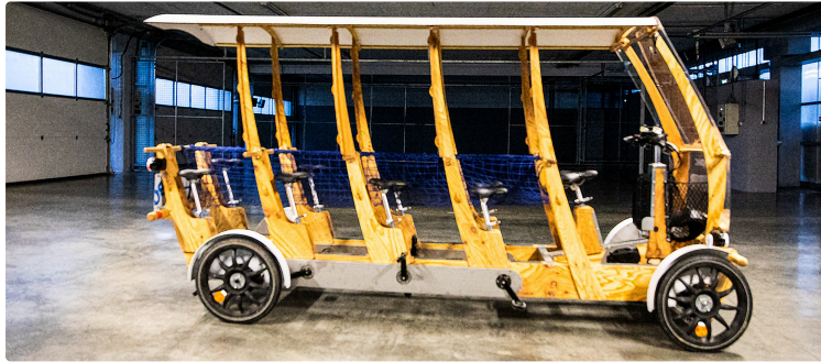
CC du Bas-Armagnac : des vœux pleins d'espoir et d'optimisme

« Un territoire qui recèle des richesses infinies »