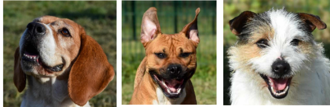
Maya, Balthazar et Obito, les trois petits nouveaux de la semaine !

Cette semaine, la SPA vous présente trois nouveaux venus arrivés en janvier au refuge.