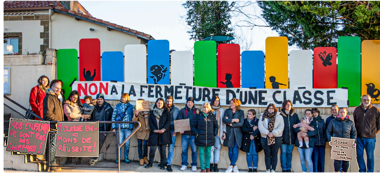
Le Houga: l'Éducation nationale sabote les investissements de la commune

Quand on pense services publics, c'est l'Éducation nationale qui vient la première à l'esprit, avant les autres. Mais que doit-on penser quand c'est l'inspectrice académique qui détruit une école florissante, objet de tous les soins de la municipalité du Houga ? Une classe de l'école maternelle est menacée de fermeture à la rentrée des classes de 2025, alors que la commune a multiplié les investissements pour assurer aux enfants un enseignement de qualité et un bien-être reconnu de tous.