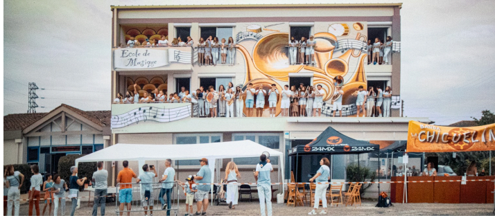
Les musiciens de Nogaro sur les balcons de l'Ecole de musique pendant le passage du Tour de France