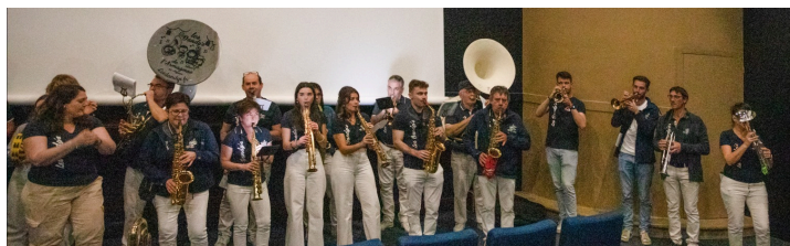
Les Dandy's de l'Armagnac jouent également avant la projection