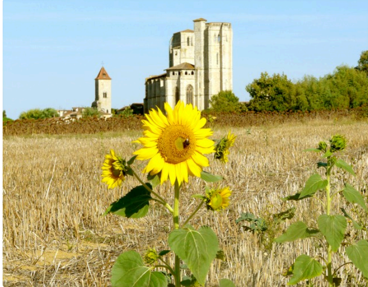
Communiqué de la Communauté de Communes de La Lomagne Gersoise

Plan Local d'Urbanisme intercommunal (PLUi).