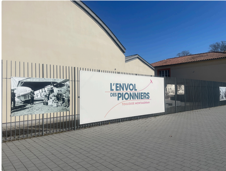
La chronique de Neyla : l'Envol des Pionniers, sur les traces des héros de l'Aéropostale

Neyla Dahrouch , gersoise étudiante en journalisme passionnée, vous invite chaque dimanche à découvrir les trésors de la Ville Rose.