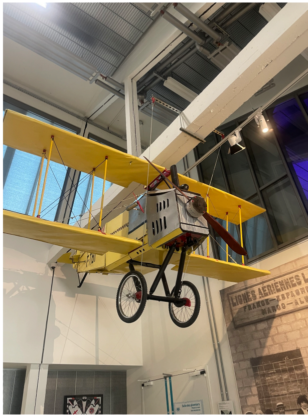
Texte et photos : Neyla Dahrouch