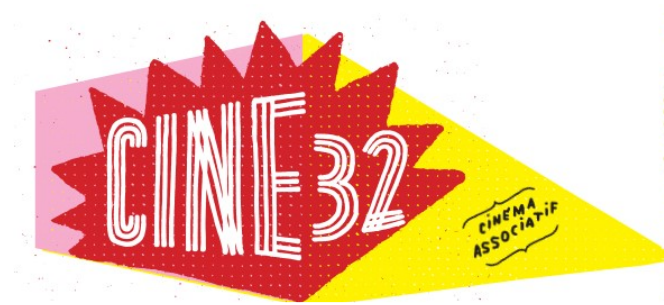
Le Printemps du cinéma et autres rendez vous

LE PRINTEMPS DU CINÉMA aura lieu du 23 au 25 mars. L'intégralité des séances seront au tarif unique de 5€.