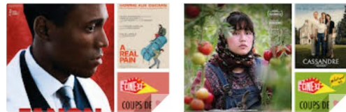
PJ CINE 32.jpg