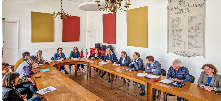
34,1 % des 60 980 Gersois et Gersois invités au dépistage du cancer du côlon l'ont fait en 2022-2023 ; 718 tests se sont révélés positifs sur ces 34 %.

Le Côlon Tour est passé par Nogaro vendredi 21 mars 2025. Son but : sensibiliser au dépistage du cancer du côlon les hommes et les femmes de 50 à 75 ans. Ce dépistage est entièrement gratuit.