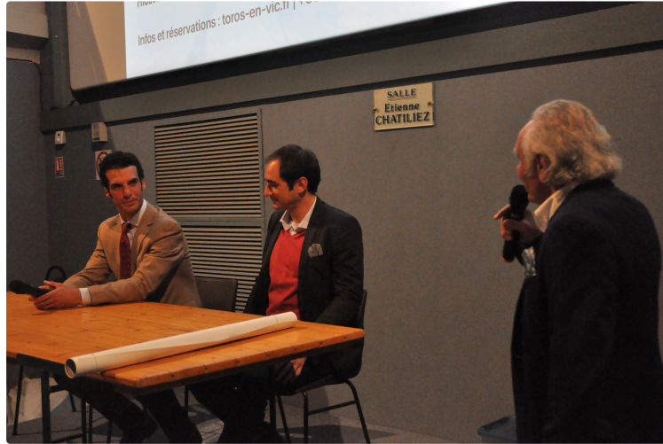
Soirée de présentation de la Feria 2025 sous le signe de l'émotion et de la passion

Samedi dernier, le Club Taurin Vicois a innové en organisant sa traditionnelle soirée de présentation de la Feria dans la salle du cinéma de Vic-Fezensac, une salle comble pour l'occasion.