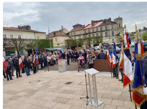
Vue d'ensemble de la cérémonie.jpg