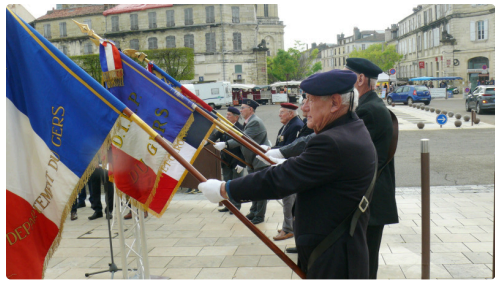
13 porte-drapeaux étaient présents.JPG