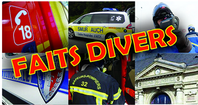
Suite mortelle d'un accident de la circulation