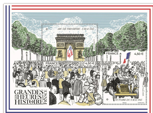
1125123_GHHF_80 ANS VICTOIRE 8 MAI 1945.jpg