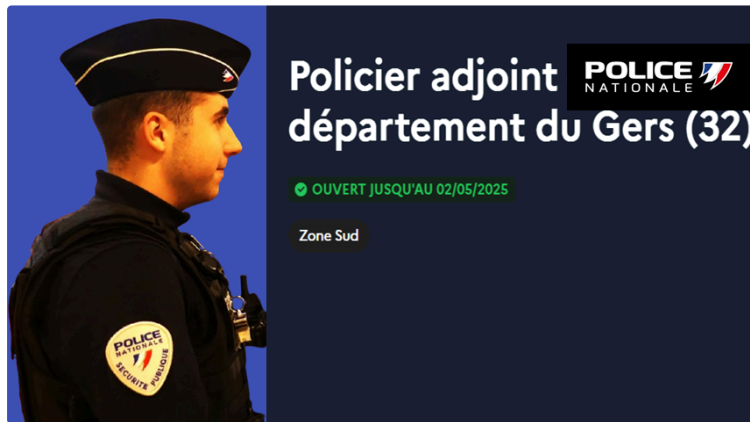
Je deviens policier adjoint au commissariat d'Auch.