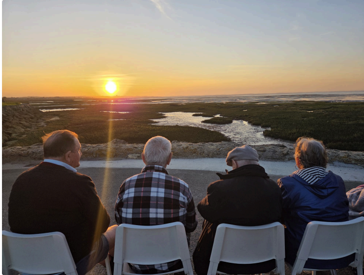
Séjour ensoleillé à Gujan-Mestras pour des résidents de l' EHPAD de l'hôpital