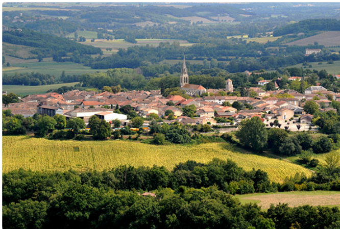
L'association " Les Chats libres de Saint-Clar" sera présente ce dimanche au vide-grenier du village .....

L'association "Les Chats libres de Saint-Clar" sera présente sur le vide greniers de Saint -Clar le 4 mai. Elle espère vous voir nombreux à venir découvrir son stand et à la soutenir dans les actions qu'elle mène.