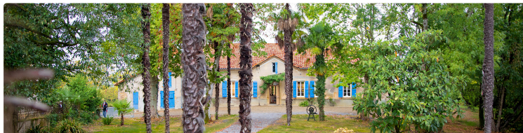
Programme mai 2025 de la Médiathèque du Houga

Voici le programme établi par la Médiathèque du Houga pour le mois de mai 2025 :