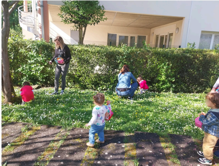
Chasse aux œufs intergénérationnelle à l'EHPAD de l'hôpital : un moment de partage et de joie

Mardi 29 avril, le soleil était au rendez-vous dans le jardin de l'EHPAD de l'hôpital de Vic-Fezensac qui a résonné des rires des tout-petits et des sourires des aînés, réunis pour une chasse aux œufs intergénérationnelle pleine de tendresse.