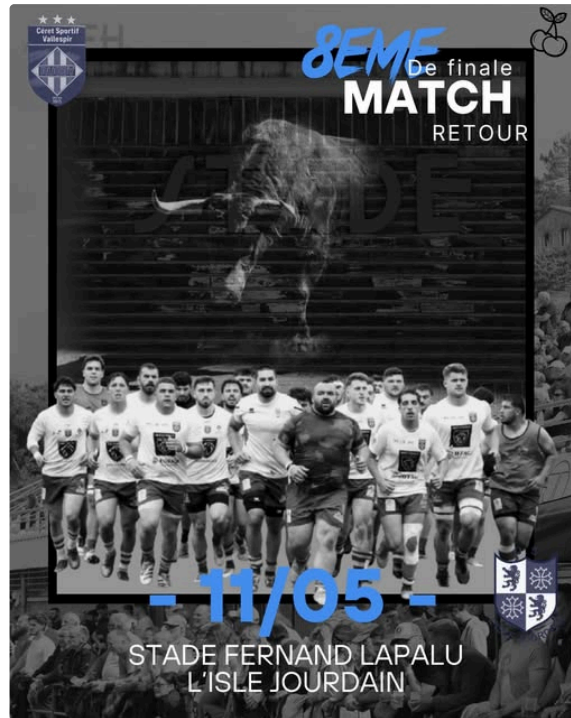
USL: le staff prudent ...