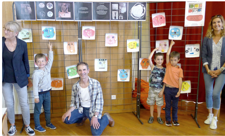
Des regards multifacettes dans des boîtes.