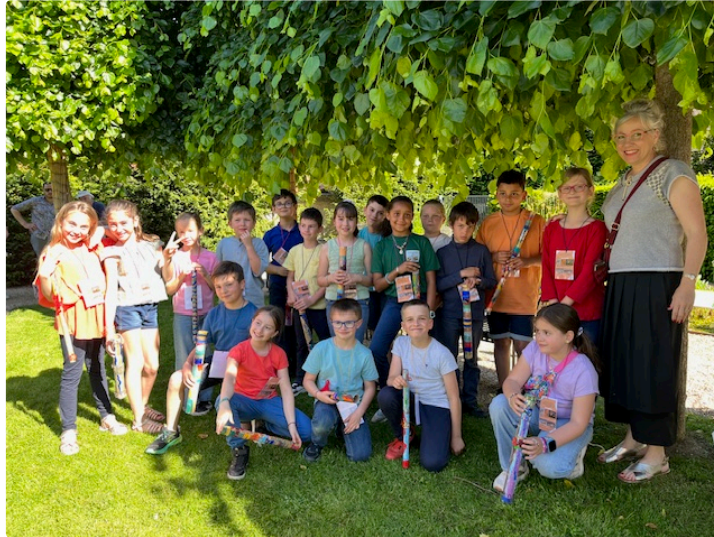
Nuit des musées : Les élèves de CE2 et CM1 ont murmuré des poèmes aux visiteurs

Pour cela ils ont créé un ingénieux dispositif