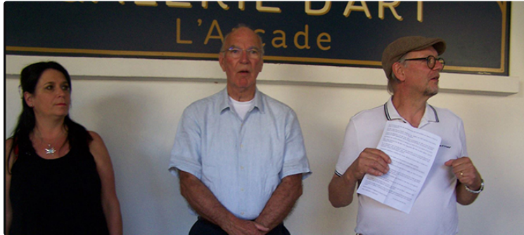
Deux artistes exposent à la galerie " L'Arcade ", ils sont les explorateurs des jeux du regard et de la lumière.