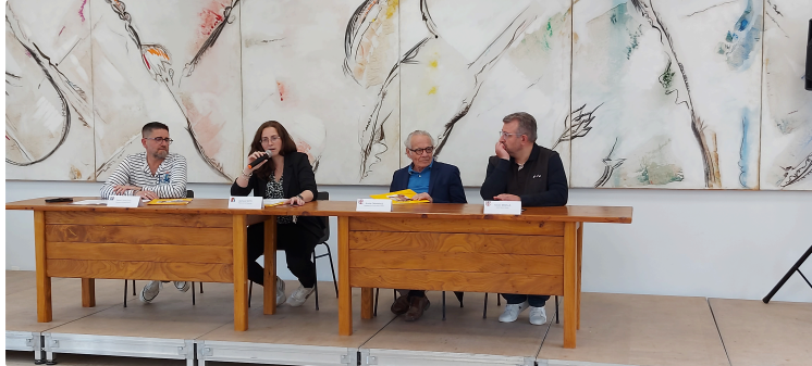
Pentecôtavic 2025 "Tous en piste", tout ce qu'il faut savoir !