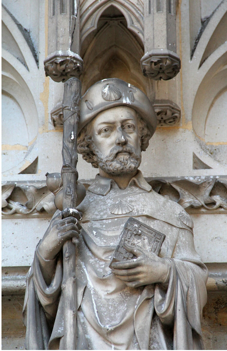
Le pèlerin

pratiquer une activité physique en plein air.