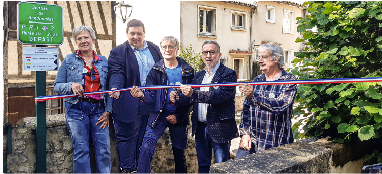
À Nogaro, les pèlerins ont à présent une bifurcation vers Lourdes

Les collectivités publiques et les organisations de tourisme (1) ont réalisé le vœu de nombreux pèlerins et randonneurs : créer une bifurcation qui mène à Lourdes, dans le Chemin du Puy, et le connecte aux deux autres itinéraires du Chemin de Saint-Jacques-de-Compostelle (le Chemin d'Arles et la Voie du Piémont). C'est une prolongation du GR®101, appelée Chemin de Lourdes.