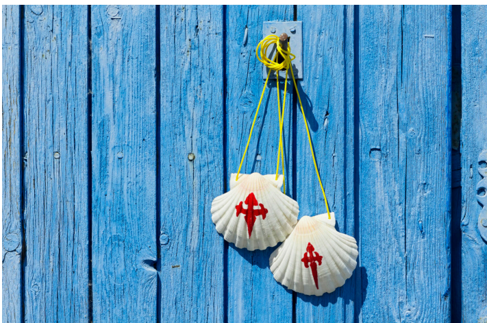
Coquilles Saint-Jacques