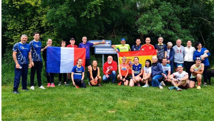
"si tu vas à Calatayud ", oui mais en courant, c'est le pari d'Oxygène 32