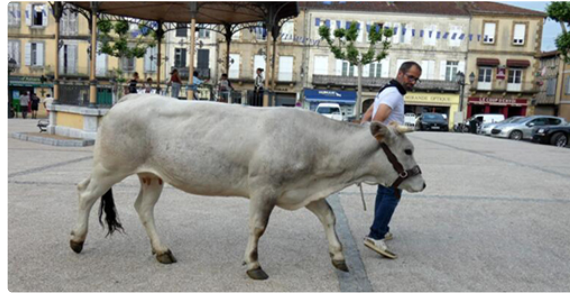
Une belle Mirandaise sur la place d'Astarac.