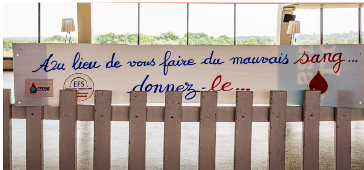
Le slogan du jour