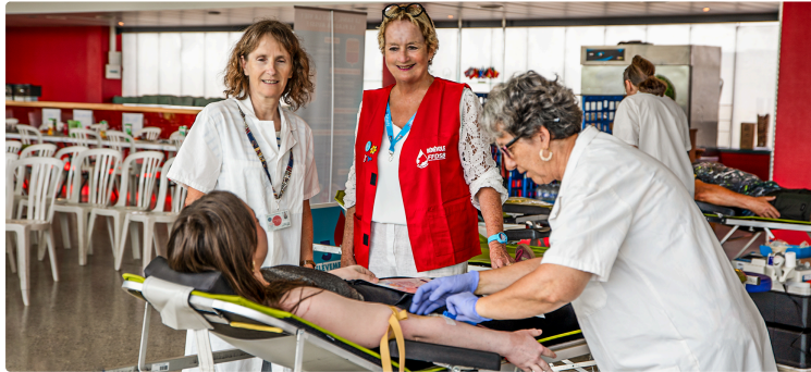
Record pour la collecte de sang au circuit de Nogaro

100 donateurs se sont déplacés malgré la chaleur