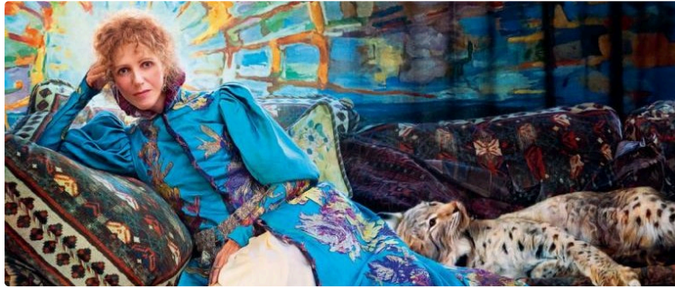
Sarah Bernhardt la divine