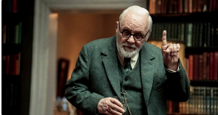
Cine Qua Non : Anthony Hopkins dans "Freud la dernière confession"