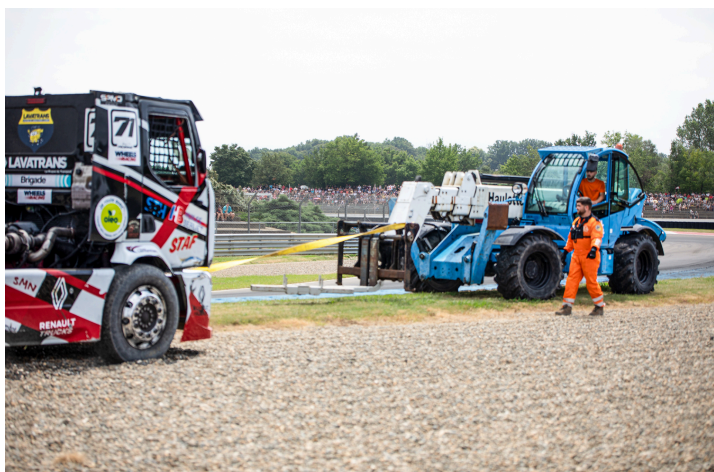
Course 3 : remorquage après un virage manqué et un atterrissage dans les cailloux