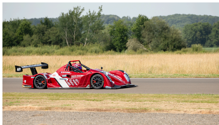
Course 4 : Nicolas Robin n°69