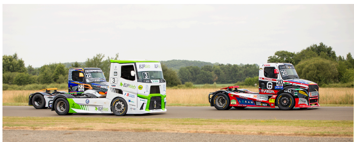
Course 3 : Téo Calvet n°20, Lionel Montagne n°3 et José Sousa n°22