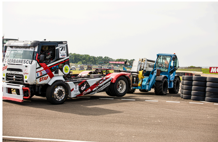
Course 4 : dépannage