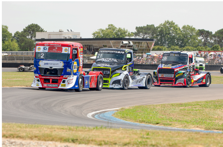
Course 3 : Thomas Robineau n° 2, Raphaël Sousa n°21 et Téo Calvet n°20