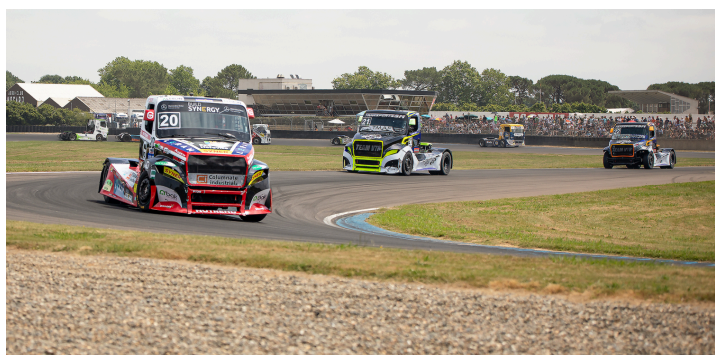
Course 3 : Téo Calvet n°20 prend la 2e place devant Raphaël Sousa n°21