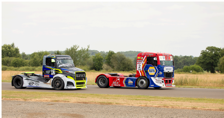
Course 4 : Thomas Robineau n°2 devant Raphaël Sousa n°21