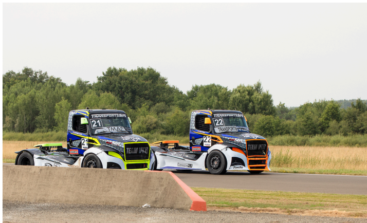
Course 4 : José Sousa n°22 et Raphaël Sousa n°21 dans la ligne droite le long de l'aérodrome