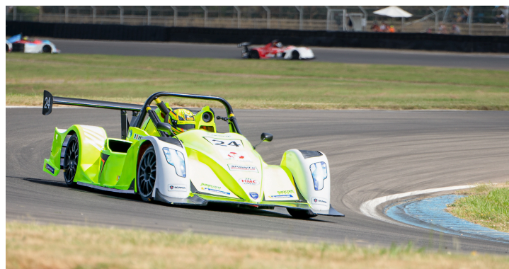
Course 4 : Xavier Fouineau n°24 en tête