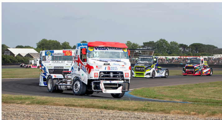
Course 4 : Fabien Neel n° 14, Aurélien Herrgott n°68, Raphaël Sousa n°21 et Téo Calvet n°20