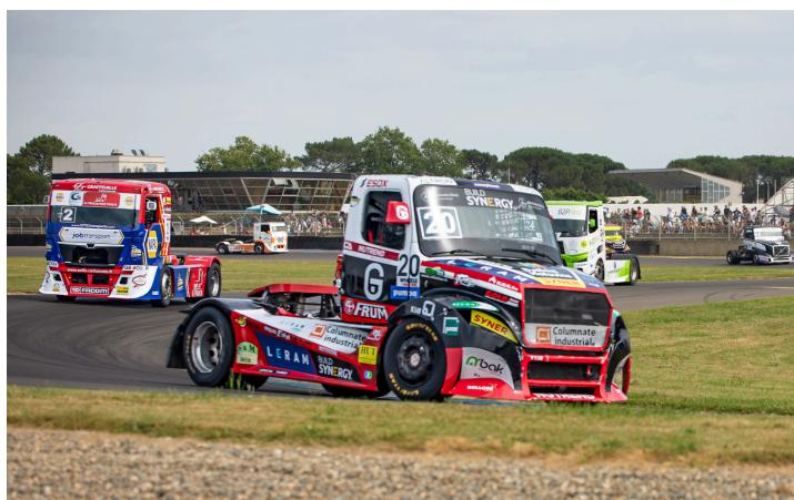
Course 4 : Téo Calvet n°20 devant Thomas Robineaut n°2