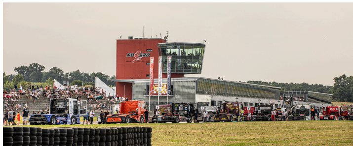
Départ de la course 4 du Grand Prix camion