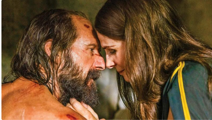
Cinequanon : nombreuses séances cette semaine et un ciné plein air !

Cela sent les vacances ! Neuf séances cette semaine et un ciné plein air gratuit, profitez-en !