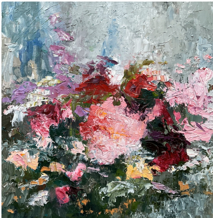
Vineart 2025 : art et vin au Domaine de Polignac avec la Cimaise Armagnacaise