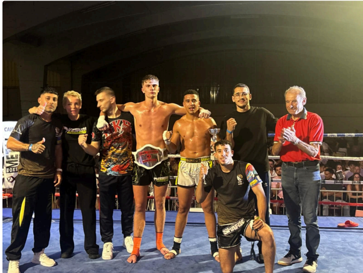
Gala Sama'Combat 2025

Samedi 14 juin 2025 , la Halle à la Volaille de Samatan s'est transformée en un véritable temple de la boxe pour accueillir la 2ème édition du prestigieux gala Sama'Combat, organisé par le club Boxons Multiboxe de Monferran Savès, sous l'égide de la FFKMDA.