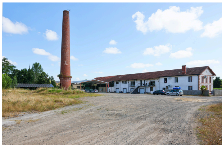
Le terrain de l'opération ; les bâtiments à droite sont ceux des photos ci-dessus

L'opération sera conduite par le bailleur social, la SA Gasconne d'HLM du Gers (le Toit de Gascogne), constructeur ; les bâtiments construits feront partie de son patrimoine.