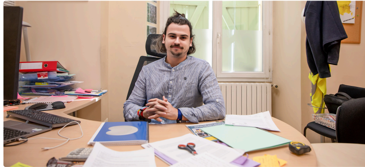
Nogaro : projet de logements à l'ancienne Tuilerie

Des logements sociaux, un habitat inclusif et des maisons individuelles