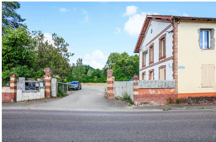
Entrée du terrain à bâtir