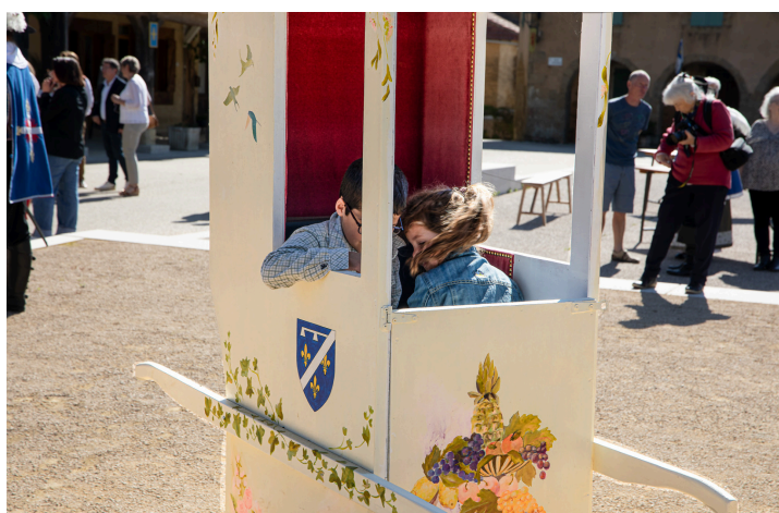
Des enfants se l'approprient

L'épreuve a lieu sur la place de Lupiac : les équipes (2 porteurs par chaise) parcourent 110 mètres le plus vite possible.