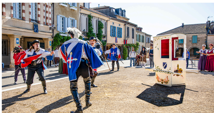
Le même jour, avec Les Lames Lupiacoises