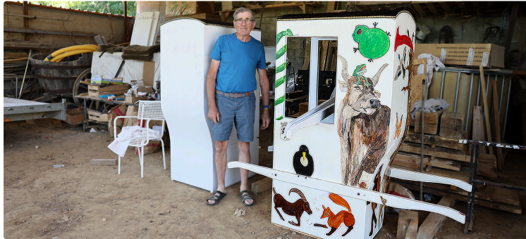
Lupiac : Championnat des porteurs de chaises à porteurs

Il sera inclus dans le Festival d'Artagnan samedi 9 et dimanche 10 août 2025