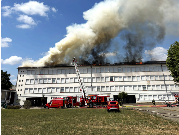
Fleurance: Incendie au collège Hubert Reeves, le département du Gers pleinement mobilisé pour assurer la rentrée scolaire de septembre

Incendie au collège Hubert Reeves de Fleurance : le Département du Gers pleinement mobilisé pour assurer la rentrée scolaire de septembre Suite à l'incendie majeur survenu ce dimanche 13 juillet 2025 au Collège Hubert Reeves de Fleurance, le Département du Gers tient à exprimer sa solidarité envers l'ensemble de la communauté éducative et à réaffirmer sa mobilisation totale pour garantir la continuité du service public d'éducation dans les meilleures conditions de sécurité.