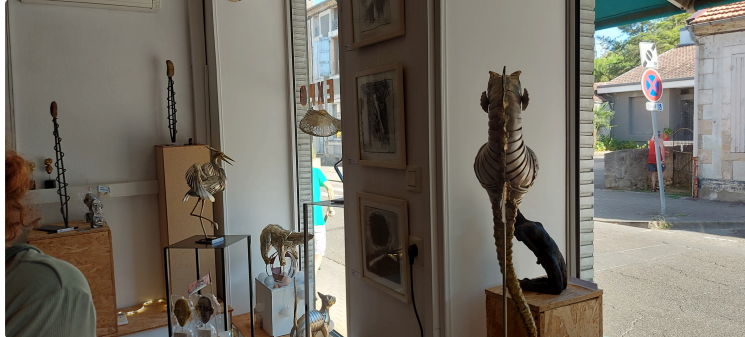
Une nouvelle exposition à découvrir à la Ligne Rouge !