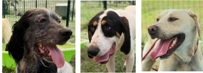
Les petits jeunes derniers arrivés à la SPA , Arlo, Yester et César

Cette semaine, ce sont trois jeunes loulous que vous présente la SPA.