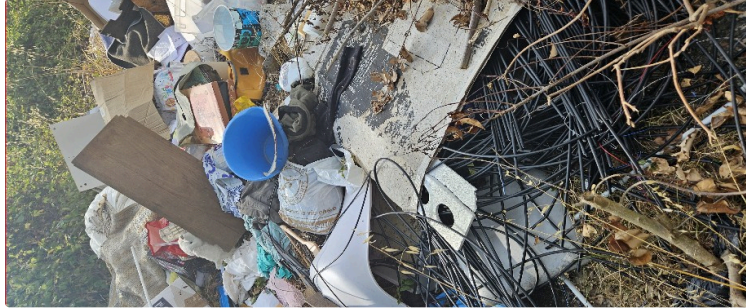
Le plus vieil édifice auscitain, un château classé devenu dépotoir !!!

Inaction des responsables de la protection du patrimoine