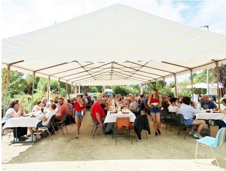
la fête au village vendredi 15 août

Tout comme les irréductibles gaulois, l'équipe du Comité des Fêtes, aidée par quelques bénévoles parvient chaque années à organiser la Fête du village. Un challenge qui sera relevé comme à l'accoutumée un 15 août, cette année un vendredi où seront proposés diverses animations :