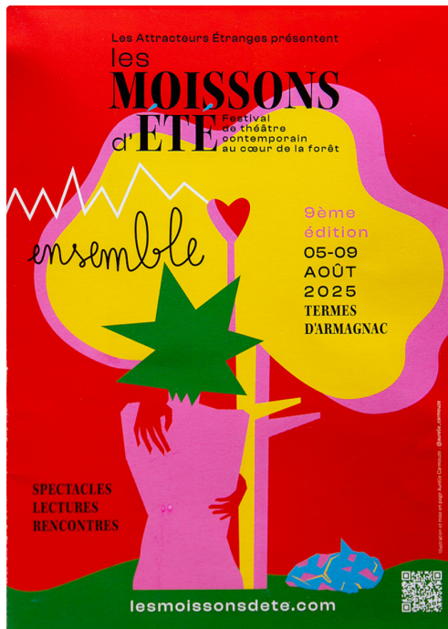
IMG_6197 JdG affiche.jpg