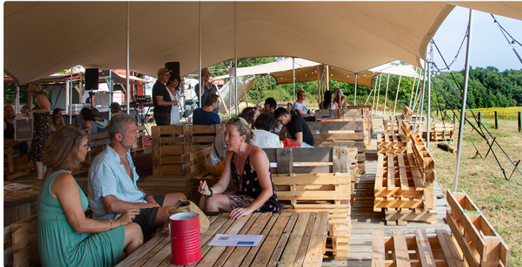
les Moissons d'Été