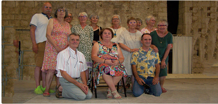
L'exposition "La Saint-Claraïse" a ouvert l'espace de la Vieille Eglise.